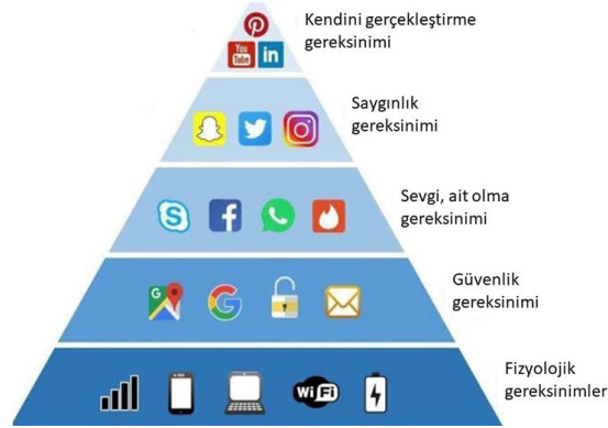
Şekil 3: Maslow 2.0 Dijital İhtiyaçlar Hiyerarşisi (Şenkardeş, 2019).

Dijital dünyanın dijital ihtiyaçlar hiyerarşisi piramidinde literatürde karşımıza çıkan son örnekler geçen yirmi yıllık sürede piramidin değişimini yansıtmaktadır. 2019 yılında paylaşılan bir piramit örneğinde ilk basamak, kişilerin online olabilmesinin öncül gereksinimlerini (cep telefonu ya da bilgisayar, wi-fi bağlantısı ve batarya gibi) en üst basamak ise Youtube, Linked in, Pinterest gibi sosyal ağları kapsamaktadır (Şenkardeş, 2019).